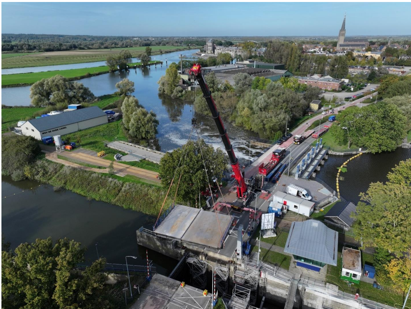
Het uithalen van de val van de brug die nu op de weg naar de loods ligt.