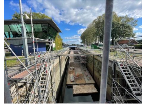
Impressie van het werk aan de brug en de sluis