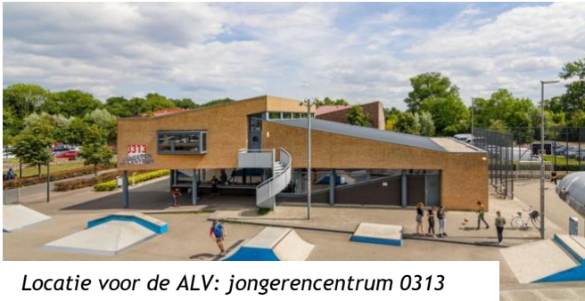
Locatie voor de ALV: jongerencentrum 0313

Belangstellende leden hebben deze keer ook een uitnodiging voor de ALV ontvangen. Belangstellende leden werden conform onze statuten nooit standaard uitgenodigd. Het huishoudelijk reglement geeft echter aan het bestuur de ruimte om belangstellende leden op de vergadering toe te laten. Om meer wisselwerking tussen alle leden te krijgen en ook de belangstellende leden via de ALV goed te kunnen informeren, hebben zij deze keer ook een uitnodiging ontvangen. Belangstellende leden hebben geen stemrecht.