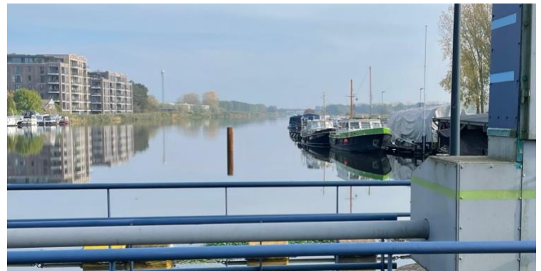
Het schip "Hendrik Antonie" aan het werk. De paal staat gelukkig op voldoende afstand van de gastensteiger waardoor de doorvaart naar het botenhuis goed mogelijk blijft.