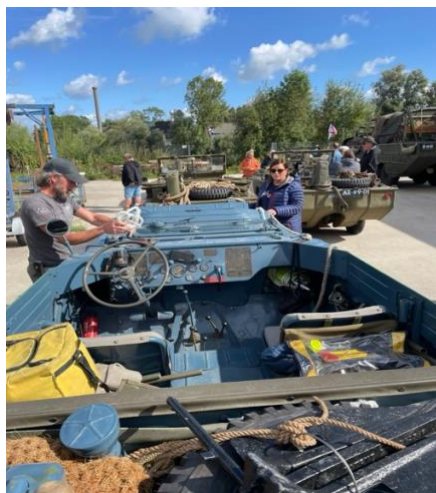
Invasie van amfibievoertuigen

Op dinsdag 20 augustus was er een bijzonder gezelschap dat van onze hellingbaan gebruik heeft gemaakt. Een groep met oud militaire amfibievoertuigen kwam via de IJssel aanvaren om bij ons op het droge te komen. Die dag zijn ze doorgereden naar kasteel Middachten en 's avond hebben ze bij de Peerdenstal in Ellecom gegeten. Na een overnachting op een camping zijn ze op woensdag weer naar ons toegekomen om via de helling weer het water in te rijden. Bij elkaar een bijzonder schouwspel. Hun volgende stop via de IJssel en de weg was Heerde.