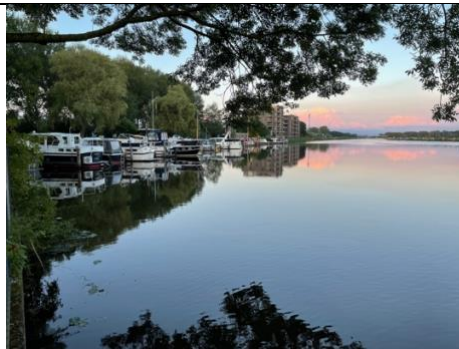
Rustige avond juli 2024