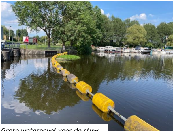
Grote waternavel voor de stuw

Al enige jaren hebben we in de Oude IJssel last van de grote waternavel. Deze begint jaarlijks vanaf eind mei te groeien. De groei is het sterkst in de maanden juli en augustus. Ook op andere plekken in Nederland tref je deze exoot aan. Zelf kwam ik dit jaar in Drenthe en Overijssel ook grote plakaten tegen. De planten vormen drijftillen, een soort dekens op het water. De groei begint meestal vanaf de oeverlijn, maar ook tussen rietkragen.