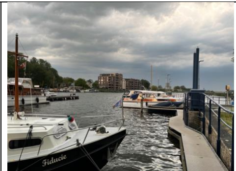
Donkere wolken augustus 2024