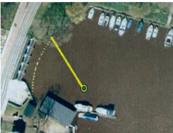
IJzeren paal met schuine lijn om de waternavel 'in de hoek te drijven'.

Omdat de grote plakaten zich o.a. bij ons botenhuis ophopen heeft het Waterschap ons drie alternatieven gepresenteerd. De voor ons meest acceptabele is dat er een ijzeren paal voor ons botenhuis komt met een lijn schuin naar de overzijde. Het is een lijn die er voor moet zorgen dat de waternavel wordt tegengehouden en naar de hoek aan de overzijde drijft. Daar staan drie bomen (Essen) waarvoor al een kapvergunning is verleend. Op de plek die dan vrijkomt kan het Waterschap met een kraan de waternavel uit het water tillen. Het inzetten van een schip met een kraan voor de stuw vinden ze te gevaarlijk en is voor het Waterschap dan ook geen alternatief.