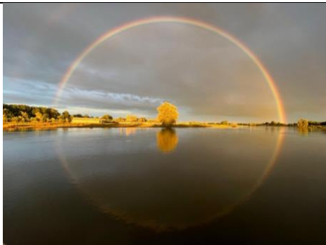
IJssel bij Deventerjuni 2024