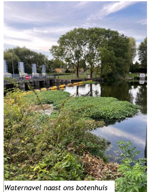
Waternavel naast ons botenhuis

(nog) niet tegen. Al deze exotische waterplanten werden tot enkele jaren geleden gewoon in tuincentra verkocht, maar zijn inmiddels verboden. Via vijvers en leeg gekieperde aquaria zijn de planten in de natuur terecht gekomen.