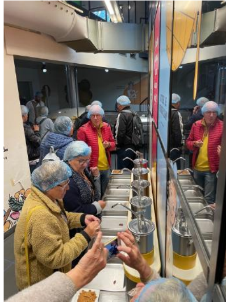
Proeven, proeven, proeven....