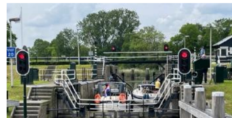
Waaiersluis met schutting van 2 boten per keer

Op dinsdag hebben we via de Hollandse IJssel het laatste stuk naar Gouda afgelegd. De Waaiersluis gaf enig oponthoud omdat er telkens slechts twee schepen gesluisd konden worden. Na de sluis hebben we op elkaar gewacht