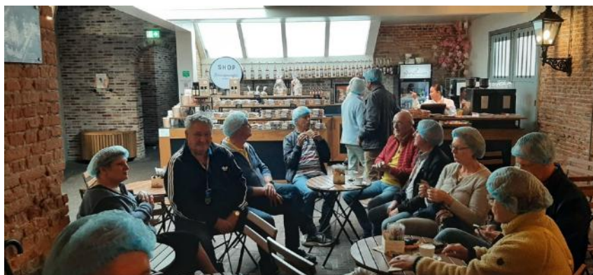
Koffie met siroopwafel en ander lekkers