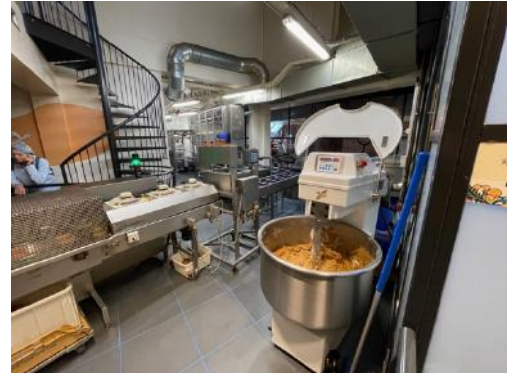
Kijkje in de fabriek.

Een siroopwafel is 45 seconden 'onderweg'. Het oudste recept van Nederland uit 1810. Er worden ruim 10.000 wafels per dag gemaakt uit 100% natuurlijke ingrediënten.