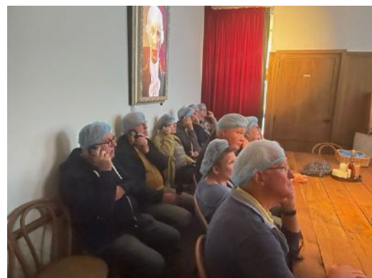
Aandachtig luisteren bij de uitleg over de siroopwafelfabriek