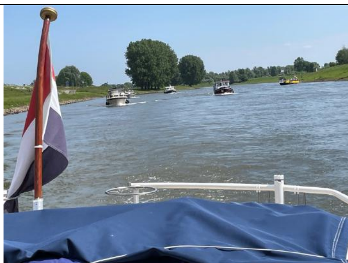
Op de heenreis met flinke tegenstroom op de IJssel ter hoogte van het pontje bij Rheden

De volgende dag werd de tocht om 9.30 uur vervolgd richting IJsselstein. Een aantal deelnemers voerden op de Lek al voorbij de afslag naar de Koninginnesluis, maar konden gelukkig snel keren. Voor degenen die de sluis kennen weten dat het een grote ovale kom is met bakstenen muren die naar beneden schuin naar binnen lopen. We merkten al snel dat het vasthouden van het