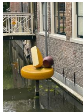
‘Stilleven in de gracht’ in Gouda