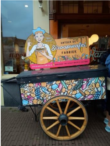
Siroopwafelfabriek op de Markt