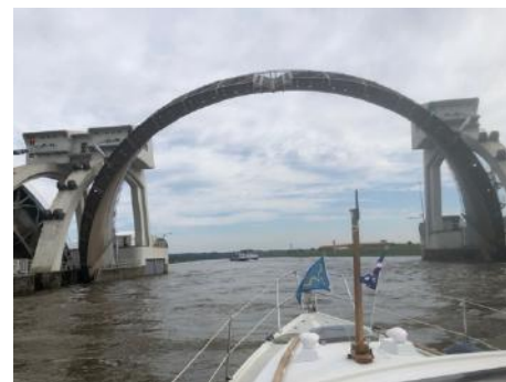
De stuw bij Driel staat gemiddeld 75 dagen per jaar open en nu dus ook