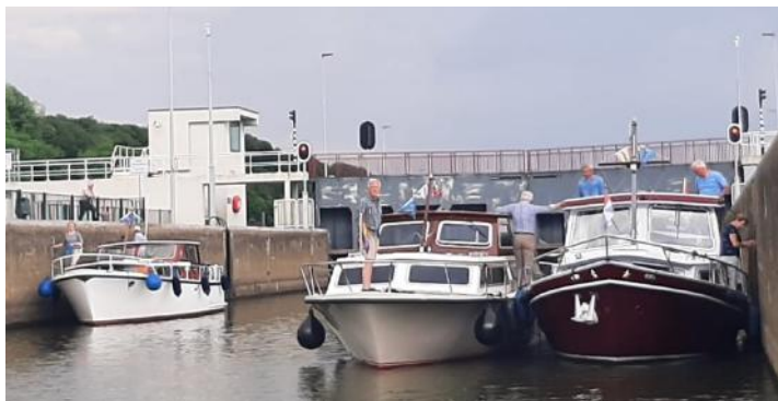
Gebroederlijk aan elkaar vastgemaakt voor een sleep naar Wageningen