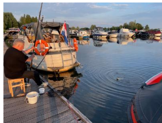
Kees in zijn element: een hele gróóóóóóte vis