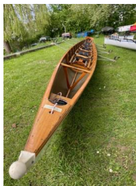
Zeer fraaie vaartuigen