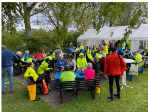
Grote belangstelling voor de mosterdsoeptocht