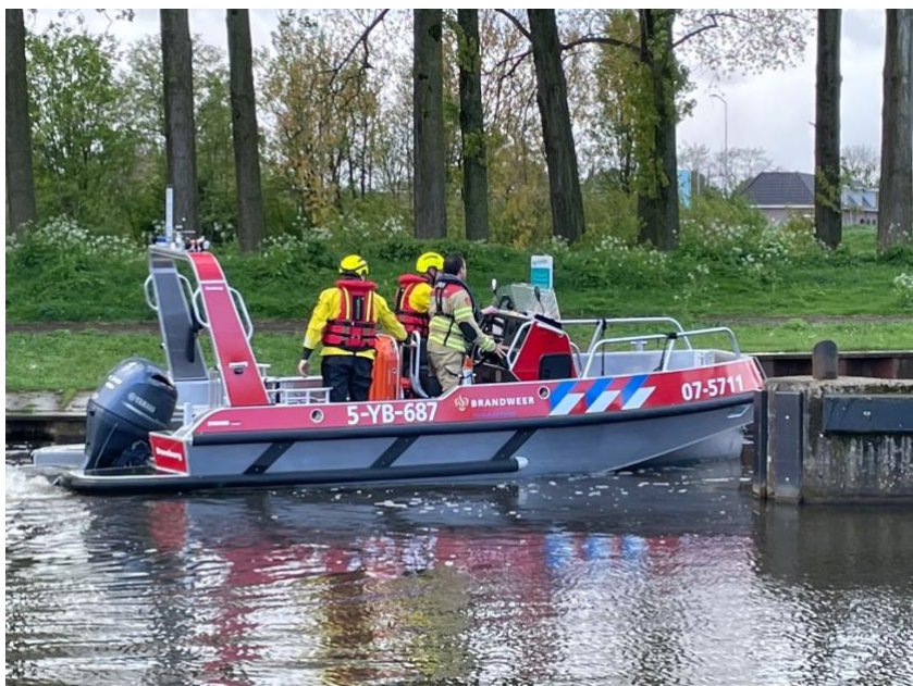
Brandweer in actie voor de te water geraakte roeier

kwam de brandweer in actie door bij de helling bij de sluis hun boot te water te laten. Echter duurde dit zo lang dat wanneer je hierop zou moeten wachten je al lang verdronken zou zijn. Gelukkig is het met de man goed afgelopen, aldus de wedstrijdleiding.