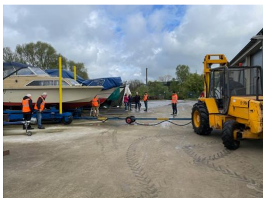
Onze 'oranje hesjes' ploeg