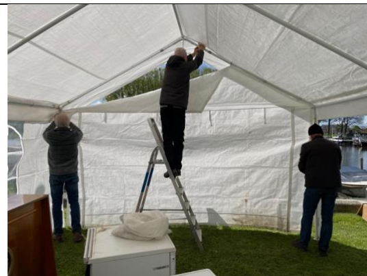
Opbouw van de tent