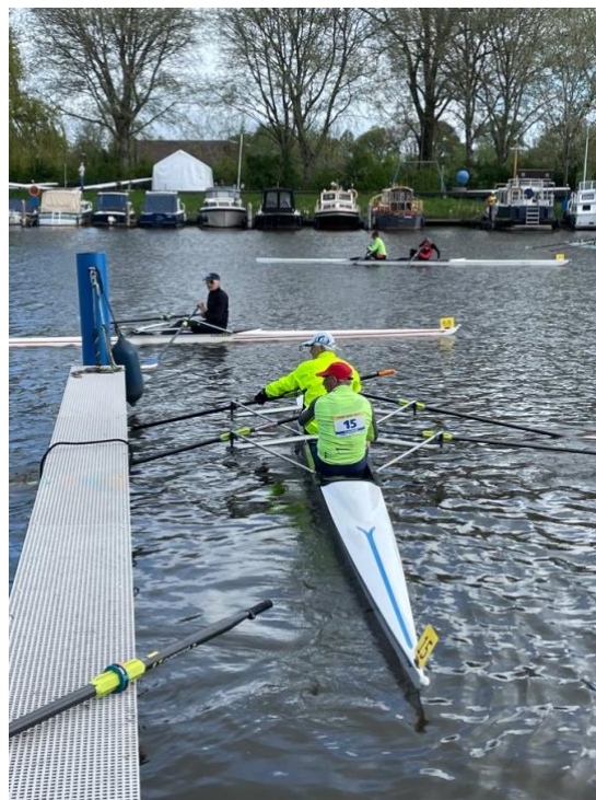
Voor aanvang van de race

Helaas gaat het niet altijd goed. Ter hoogte van de brug bij Hoog Keppel is een 74-jarige man uit zijn boot gevallen. Roeiers worden er op getraind hoe ze hier mee om moeten gaan, echter wanneer omstanders 112 bellen, gaan alle alarmbellen af. Zo