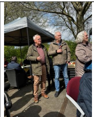
Aandachtig luisteren naar de toespraak