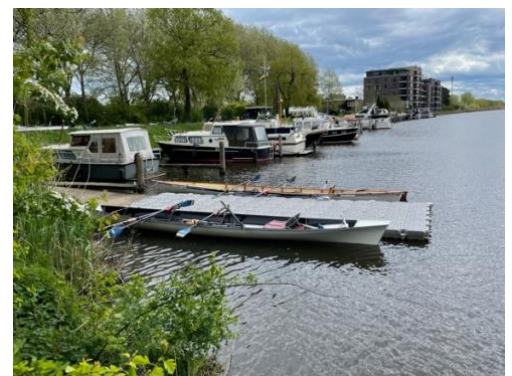
Verlengende steiger voor de Oude IJssel Race en Mosterdsoeptocht