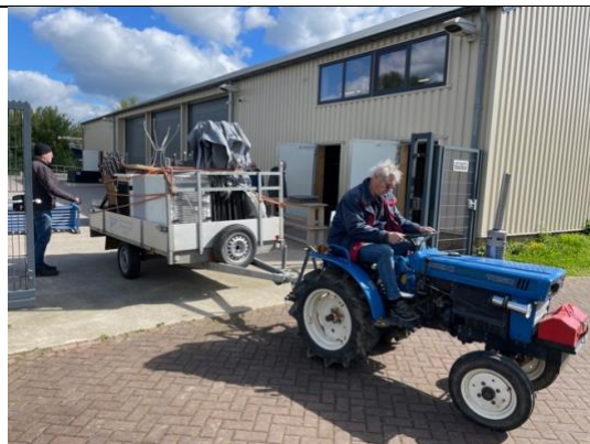
Verhuizing van alle materialen van de opslag naar de tent op Noord