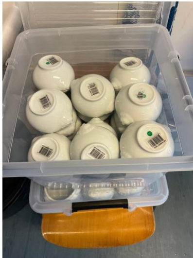
Ook de afwas hoort er bij....