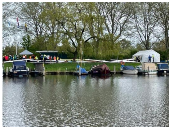
Ontvangst van de deelnemers op Noord