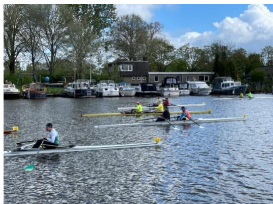
Voor aanvang van de race

De dag voor de opening van het vaarseizoen was de jaarlijkse Oude IJssel race. Deze wedstrijd voor skiff's en tweeën mag zich in een toenemende belangstelling verheugen. Waren er vorig jaar nog 70 deelnemers, dit jaar was dit al gestegen naar 90! Alle deelnemers worden door ons evenemententeam met een kop koffie ontvangen. De race eindigt 12 kilometer verderop bij de Ank in Doetinchem. De snelste doet dit in ruim 47 minuten en de hekkensluiter in 1 uur en 30 minuten.